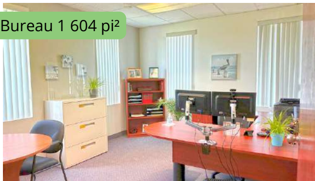
Bureau 1 604 pi 2